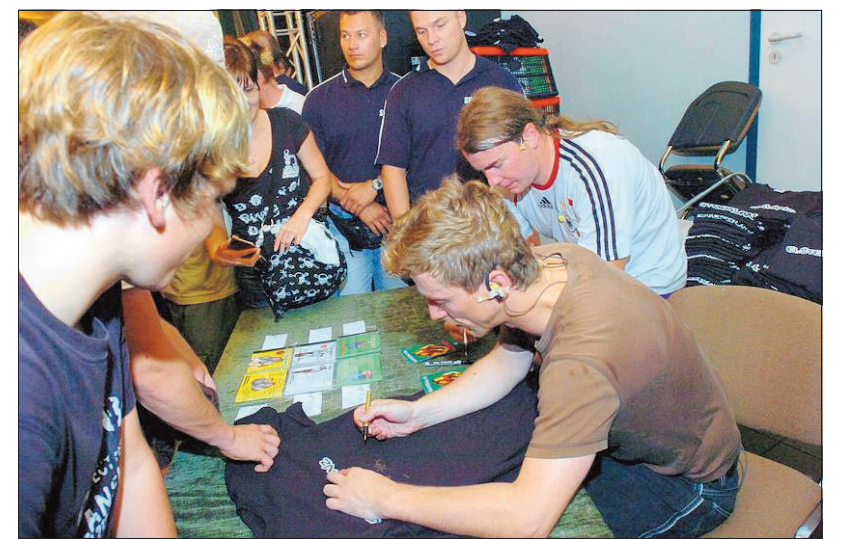
Von den Fans umlagert: Nach dem Konzert hatten Elsterglanz noch jede Menge Autogramme zu schreiben.

cher wohl auch nicht mehr aus dem Sinn. Auf ihrer „LariFariTour“ zeigten sie neue „Sketche“, wenn man diese so bezeichnen kann. Und natürlich diverse Songs von den bekannten CDs sowie auch neue. Ein Highlight war eine „neu synchronisierte“ Sechs-Minuten-Episode aus