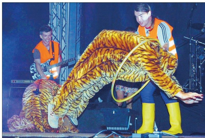
Keine Angst vor wilden Tieren: Auch gewagte Dressur-Nummern gehören zum Programm von Elsterglanz.

den Elsterglanz-Fans kann man ihnen täglich in Eisleben, Lüttchendorf oder Hettstedt auf der Straße begegnen.